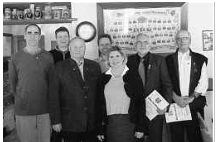
Bild der geehrten Sänger, die Personen im Bild v.l.n.r.: